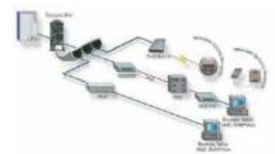
Topología típica de la gestión de red UPS

*Las tarjetas de comunicación son productos opcionales.