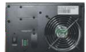
Puertos de Comunicación