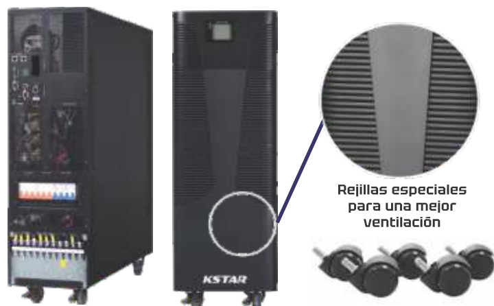
Rejillas especiales para una mejor ventilación