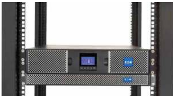
2U UPS con 1U EBM en rack de 4 postes

Esta tarjeta de interfaz de red mejora la confiabilidad del sistema de alimentación al proporcionar advertencias de problemas pendientes y ayudar a realizar un apagado ordenado y elegante de los servidores y el almacenamiento.