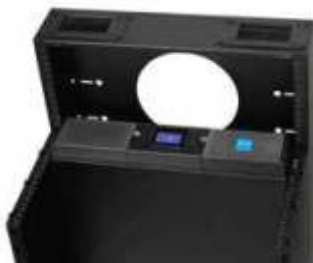
UPS 9PX montado verticalmente en el MiniRaQ de Eaton, perfecto para lugares confinados

*Costo de batería y mano de obra para un reemplazo.